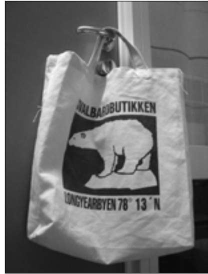
oben: Handelsüblicher Ökobeutel, Modell Bärenmarke. rechts: Fackeln vorm Kreuz, Gedenken zu Allerheiligen